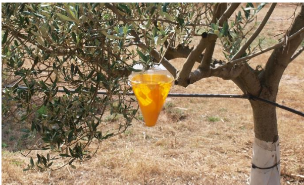
Trampa de captura masiva para mosca del olivo.

Las trampas se colocan una vez se detecten los primeros adultos, momento en el que nos encontramos actualmente, o incluso con unos meses de antelación (el momento vendrá marcado por las indicaciones del fabricante, en caso de ser un producto comercial). Esto reduce la población adulta y evita que se produzca la puesta.