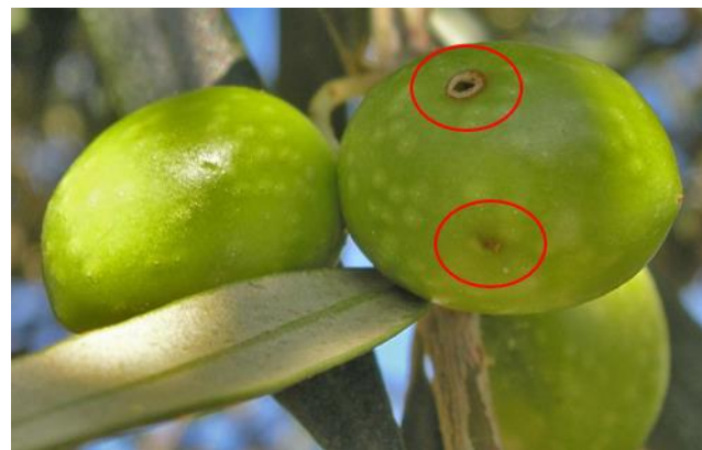
Orificio de picada (abajo) y orificio de salida (arriba) de mosca en aceituna.

Las curvas de vuelo generadas a partir de las observaciones de estas trampas, se actualizan semanalmente, y pueden consultarse dentro del apartado de Protección de Cultivos de la página web www.larioja.org/agricultura .