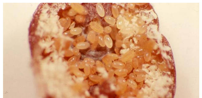
Larvas y huevos de cochinilla en eclosión.

El porcentaje de eclosión se controla levantando los adultos con cuidado, y observando el interior de los mismos con una lupa. Los huevos sin eclosionar muestran un color entre blanquecino y rosado, mientras que los huevos ya eclosionados aparecen como un polvillo blanco. Las larvas adultas tienen un color entre rosado y anaranjado, que puede asemejarse en ocasiones al de los huevos, pero se puede apreciar el movimiento de las mismas, e incluso observar sus extremidades.