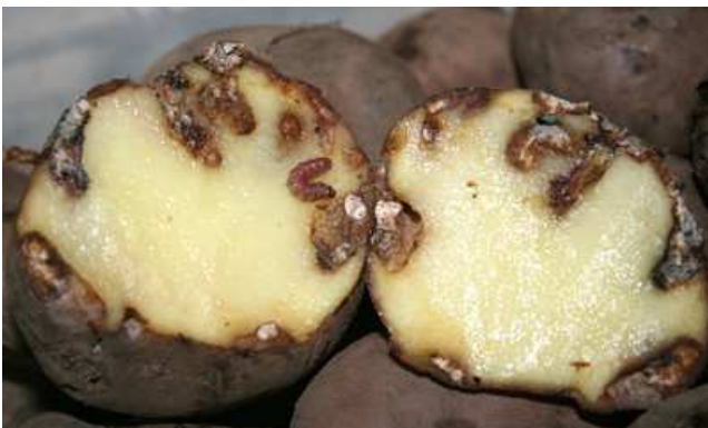
Tubérculo dañado por Tecia solanivora .

El único hospedante identificado hasta la fecha es la patata, atacando al cultivo tanto en campo como en almacén. Los síntomas que producen las larvas sobre los tubérculos, son galerías, superficiales inicialmente y que van aumentando en profundidad posteriormente. Su presencia pasa desapercibida hasta el momento de la cosecha.