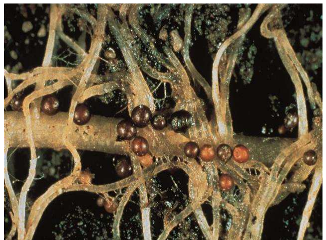
Quistes de Globodera producidos en el sistema radicular.

Las hembras de estos nematodos se transforman en quistes adheridos a las raíces para soportar condiciones ambientales adversas y proteger a la descendencia. Esto provoca un menor crecimiento y actividad de las raíces, provocando una menor absorción de agua y nutrientes. En consecuencia se produce un menor número de tubérculos, de tamaño menor a los producidos en parcelas no afectadas.