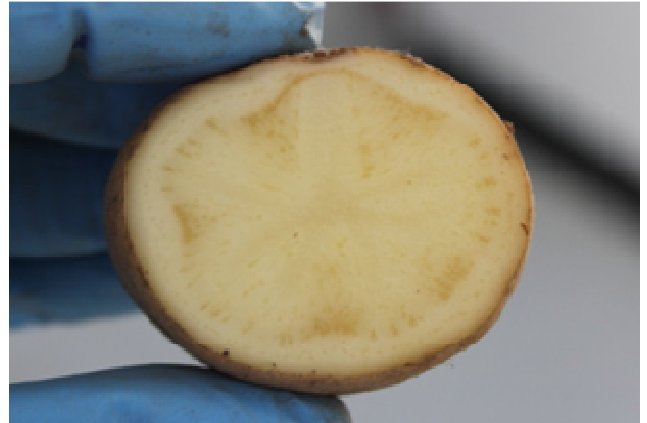
CaLsoli en tubérculo. Centro de Investigación y Formación Agraria (CIFA).

En la parte foliar produce entrenudos cortos, enrollamiento de las hojas hacia el haz, amarilleamientos y coloraciones púrpuras en tejidos jóvenes. Asimismo produce tubérculos aéreos, reducción de tamaño del tubérculo y decoloración del mismo. El síntoma más característico se produce en la parte interna del tubérculo, con un manchado similar a las rayas de una cebra, que se aprecia mejor cuando se fríe la patata (“Zebra Chip”).