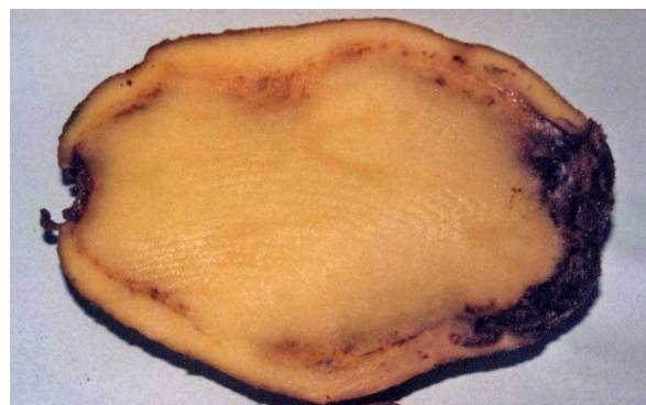
Síntomas de Clavibacter michiganensis .

Si la infección está muy desarrollada, al presionar, aparecen unas gotitas pastosas blanquecinas de mucus bacteriano en el anillo vascular.