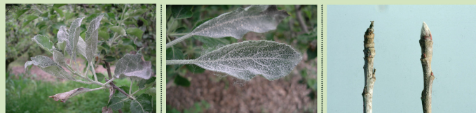
1. Infección primaria. 2. Detalle hoja infección primaria. 3. Parada invernal. A la derecha brindilla sana, a la izquierda oclada.