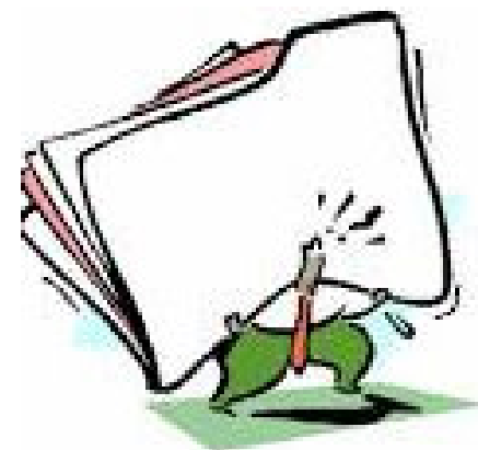
Documento de Asesoramiento