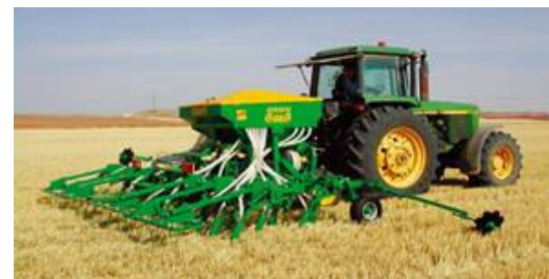
TÉCNICAS CULTIVO ADECUADAS