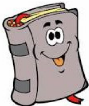
Herramienta: Guías de cultivo

Actividad en TODO territorio nacional. Comunicación