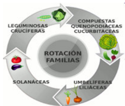
ROTACIÓN DE CULTIVOS