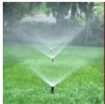
FERTILIZACIÓN, RIEGO Y DRENAJE