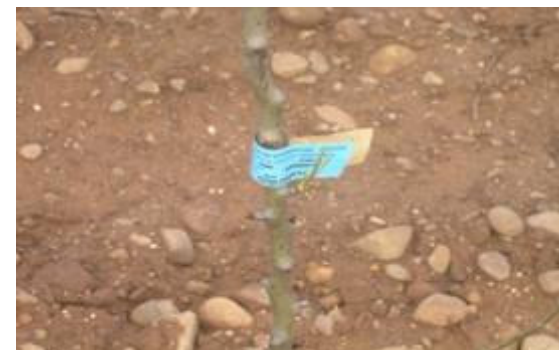
MAT. VEG. NORMALIZADO