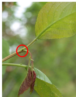
Orificio de entrada de anarsia.

(3) Solo para grafolita en frutal de hueso