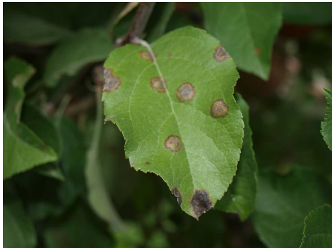
Síntomas de moteado en manzano.

No descuidar los tratamientos usando alguno de los productos indicados en el Boletín nº 4. Recordar que el cobre no se puede emplear tras la floración.