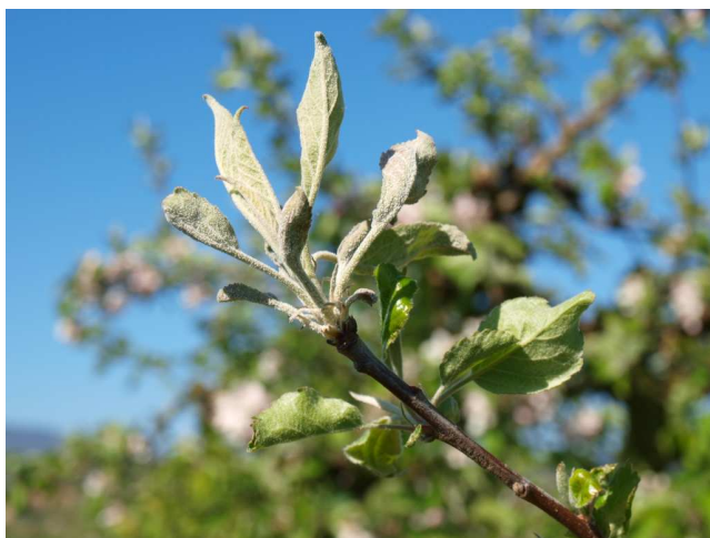
Síntomas de oídio en manzano.

Se recomienda mantener protegidas las plantaciones, realizando un tratamiento con alguno de los productos indicados en el Boletín nº 8.