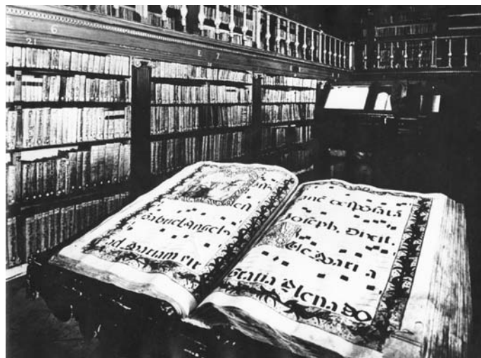
Biblioteca San Millán