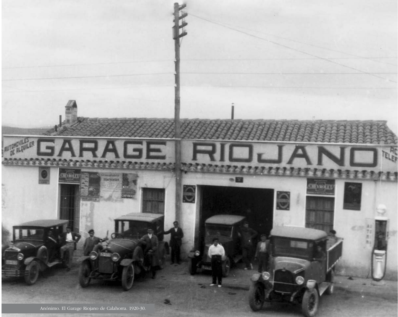
Anónimo. El Garage Riojano de Calahorra. 1920-30.