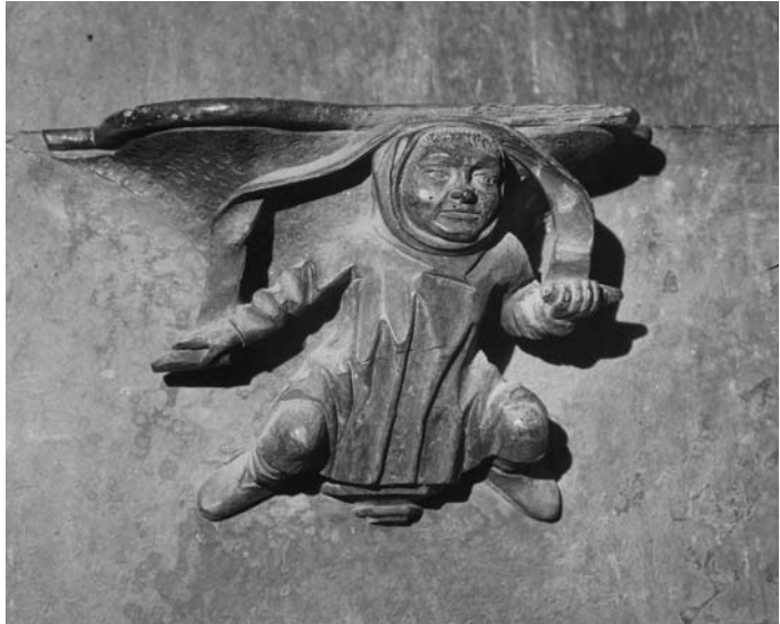
Anónimo. Detalle de una de las misericordias del Coro Alto del Monasterio de Santa María la Real de Nájera. Primera mitad del s. XX.

Durante el año 2006 el Área de Patrimonio Regional continuó el trabajo de investigación sobre el Fondo Fotográfico del IER. En concreto en este ejercicio se prosiguió con la informatización de este fondo. Junto a esta inversión el Área mantuvo su línea de actuación sobre música del siglo XVIII presente en los archivos riojanos. Este año se materializó un segundo plan dedicado a Francisco del Camino que completa al llevado a cabo en 2005. Finalmente, se potenció un tercer plan referido al Patrimonio Artístico de Santo Domingo de la Calzada originado a partir de un estudio sobre las murallas de la mencionada localidad.