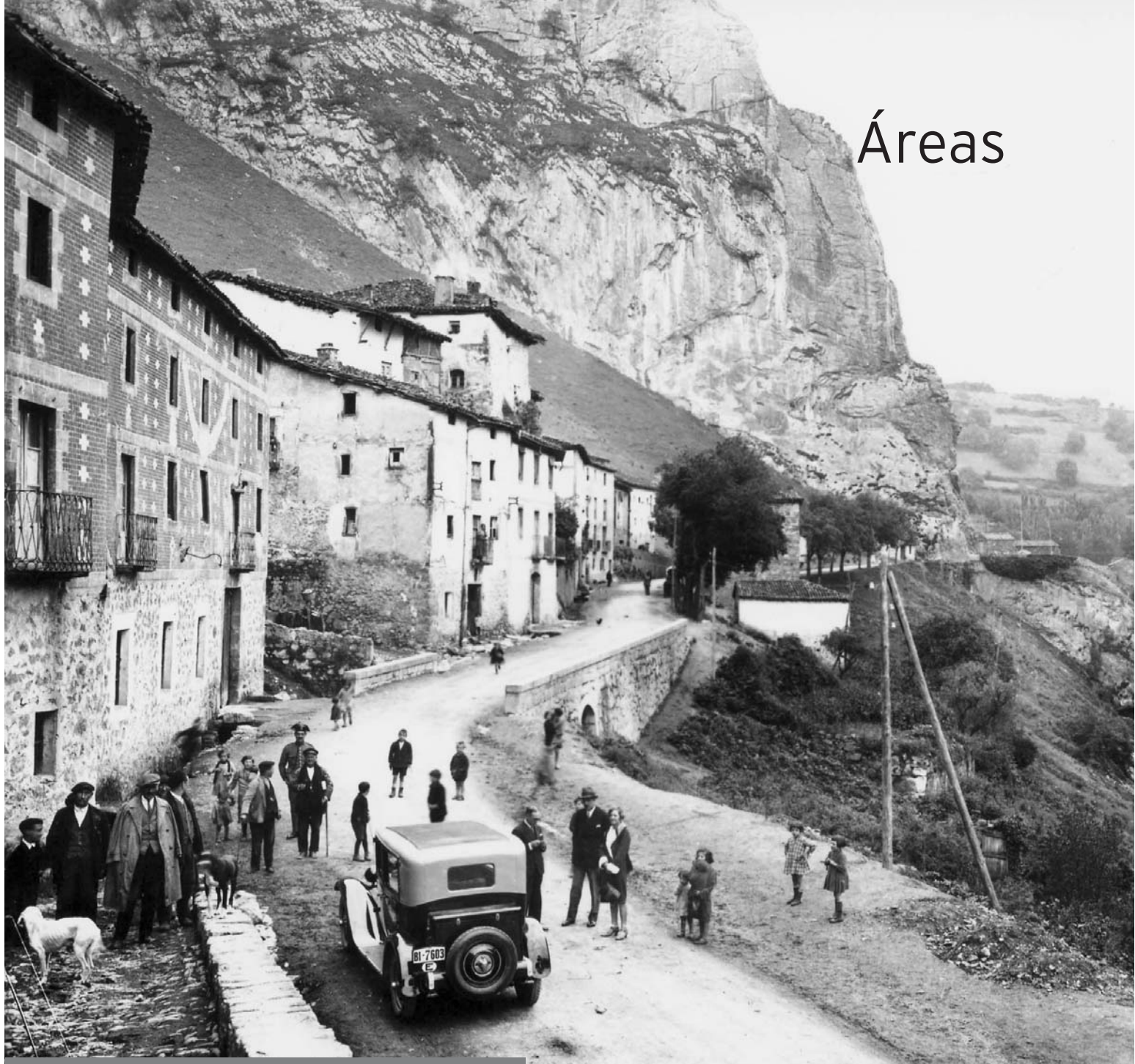
Alberto Muro. Vista general de Anguiano desde la carretera. 1920-30.