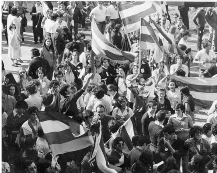
Celebración Estatuto de Autonomía. 1982

El Área de Investigación de Ciencias Sociales trata de dar respuesta a las múltiples preguntas que sobre la realidad social riojana se pueden plantear. Para ello necesita, obligatoriamente, un enfoque multidisciplinar que facilite una visión lo más comprensiva posible, de forma que, a través de los diferentes puntos de vista, se pueda tener una visión de la situación social y los retos de futuro.