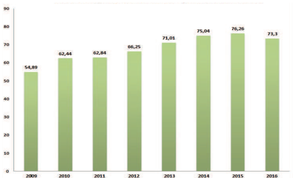
Figura 1 EVOLUCIÓN DE LA FUN. 54 EN LOS PRESUPUESTOS DE LA CAR (CAPÍTULOS DE 1 AL 9). Millones de euros.