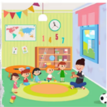
Un niño con TEA en mi clase