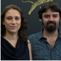
Kristina Grozeva Bulgaria, 1976

Se graduó de la Universidad Estatal de Sofía y trabajó como periodista para la televisión búlgara. Después estudió en la Academia Nacional de Teatro y Cine (Sofía, Bulgaria). Sus cortometrajes estudiantiles ganaron varios premios en los festivales internacionales de cine.