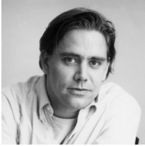
Stephen Chbosky Estados Unidos, 1970

En 1992 se matriculó en el programa de escritura de guiones de la Universidad del Sur de California. Tres años más tarde escribió, dirigió y actuó en la película independiente Las cuatro esquinas de ninguna parte . Escribió la novela epistolar Las ventajas de ser un marginado , que llevó al cine en 2012. Wonder es su tercer largometraje como realizador. Ha ejercido como guionista en títulos como La bella y la bestia , versión en imagen real del clásico de Walt Disney.