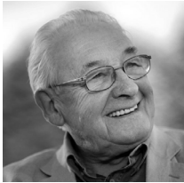
Andrzej Wajda Polonia. 1926.

El más importante de los realizadores polacos, y figura del cine mundial, que ha retratado la evolución política y social de su país. Tras la II Guerra Mundial, donde su padre fue asesinado, en la masacre de Katyn, que después retrataría en el cine, estudió pintura en la Academia de Bellas Artes de Cracovia, antes de entrar en la Escuela Nacional de Cine. Debutó en 1950 con el corto Zły chiopiec . Ha dirigido numerosos títulos de éxito internacional, como Paisaje después de la batalla (1970), El director de orquesta (1980), Pan Tadeusz (1999), Katyn (2007).