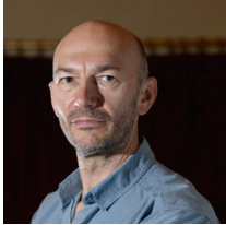
Jonathan Teplitzky Australia

Debutó en el cine con el drama romántico Mejor que el sexo , de 2000, seguido de Burning Man y Un largo viaje . Además, ha realizado diversos trabajos televisivos, como capítulos de la serie de éxito Broadchurch . Teplitzky ganó un premio BAFTA en 1993 por su trabajo en el documental de la BBC A Vampire's Life , sobre la escritora Anne Rice.