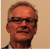
Thierry Frémaux / Francia, 1960

Lumière! L'aventure commence / Thierry Frémaux / 2016 / FRANCIA