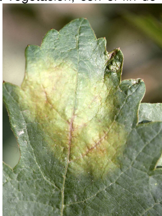
Mancha de aceite de mildiu.

Nota: a la relación de productos indicada en el Boletín nº 8 debe añadirse en el apartado "Fijación a las ceras cuticulares": mandipropamid+folpet (Pergado-Syngenta).