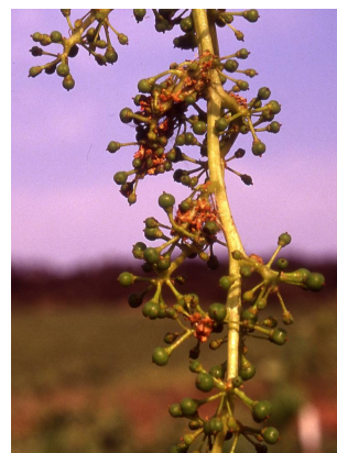
Daños de polilla en 1ª gen.

Tratamiento: normalmente las larvas procedentes de esta generación no suelen causar daños de importancia en los racimos, excepto en la variedad Garnacha que pueden producir un mal cuajado si la población es alta. Es más alarmante el aspecto que presenta un racimo atacado que los daños que sufre, por lo que no suele ser necesario tratar esta generación.