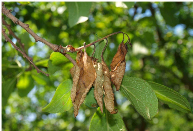
Daños de anarsia en brote.