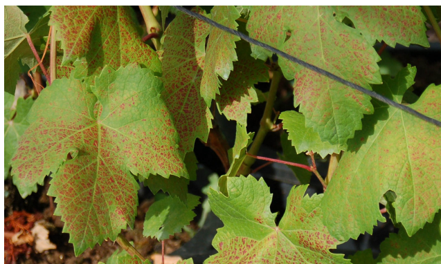
Síntomas de araña amarilla en hoja de vid.

En aquellos viñedos que al final del período vegetativo del año pasado (Octubre-Noviembre) se observaron síntomas de este ácaro, se recomienda realizar un tratamiento cuando los brotes tengan 8-10 cms. de longitud con alguno de estos productos: clofentezin* (Apolo-Aragro; Bensim-Du Pont; Tifón-Afrasa); fenbutestan* (pr. común); fenpiroximato* (Flash-Sipcam); hexitiazox* , propargita* (pr comunes); spirodiclofen* (Envidor-Bayer CS)