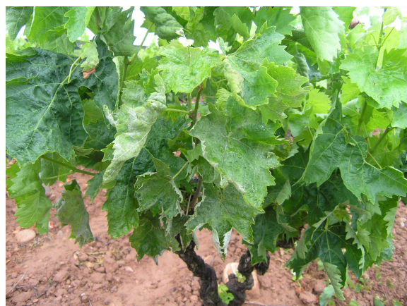
Síntomas de oidio en hoja de vid.

Esta enfermedad es endémica en nuestra zona y en años de climatología favorable puede causar daños de importancia. No obstante, se controla eficazmente si se utilizan en los momentos oportunos alguno de los productos recomendados en el cuadro siguiente. El momento oportuno para realizar el primer tratamiento es cuando los brotos tengan unos 8-10 cms. de longitud. Este tratamiento es muy importante realizarlo si el año anterior hubo problemas de esta enfermedad en la parcela.