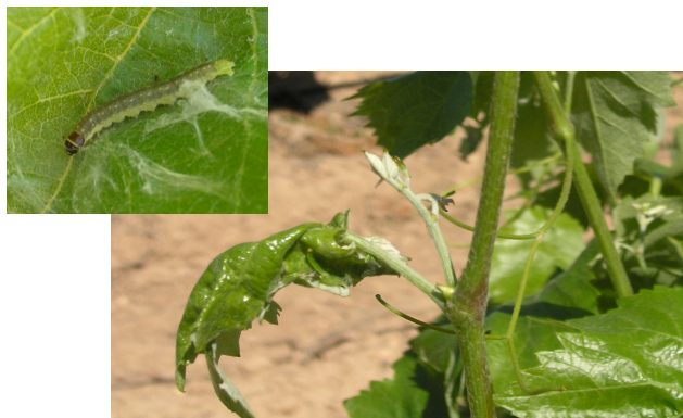
Larva y daños de piral en hoja de vid.

Debe tenerse en cuenta que el clorpirifos puede producir fitotoxicidad en estos primeros estados de desarrollo de la vid.