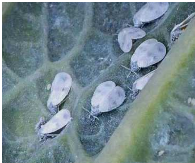
Mosca blanca en crucífera.

Una vez recolectados los cultivos se recomienda eliminar todos los restos vegetales, para evitar focos de contaminación en otras parcelas.