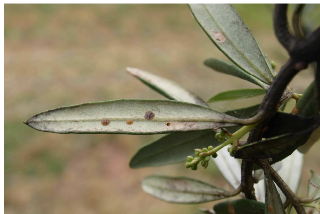
Larvas de cochinilla en hoja de olivo.

El desarrollo de este hongo es debido a la melaza que segrega la cochinilla. Si se observa su presencia por una población elevada de cochinilla, a la vez que se trata contra ella, se hará un tratamiento contra este hongo con azufre (pr. común)