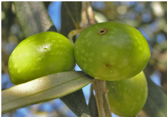
Picada de mosca en aceituna.

La mosca es una plaga importante en el olivo, por lo que aconsejamos observar las parcelas, con el fin de controlar el índice de picada, sobre todo en la zona de Arnedo, y cuando se supere el 5% de aceituna picada realizar un tratamiento.