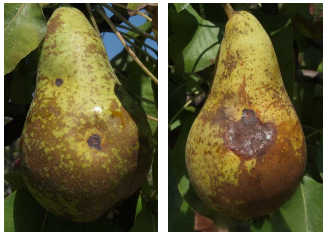
Peras afectadas por Stemphylium y evolución de las manchas.

Asimismo, se recomienda eliminar las peras afectadas de la parcela para reducir inóculo en la campaña siguiente.