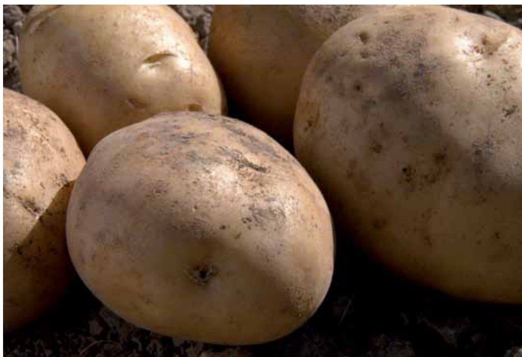
Poco más del 2% de la producción final agraria proviene de la patata.

Para conseguir cubrir las necesidades de fertilizante se ha seleccionado un abono complejo 8-8-24-4Mg para