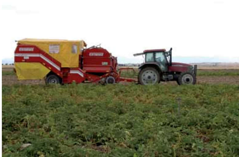
El alquiler de la cosechadora supone uno de los principales gastos del cultivo.