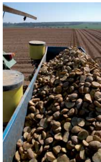
El 23% de los gastos de cultivo se destinan a la semilla.

En este apartado se incluye la mano de obra aportada por el titular de la explo-