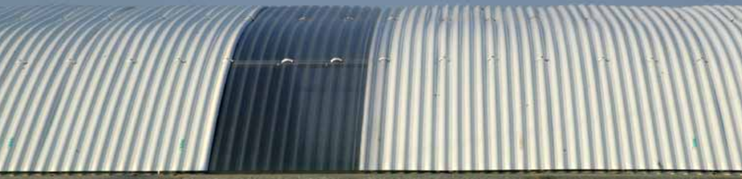
Las estructuras más empleadas en los invernaderos de La Rioja, túnel y multitúnel, conforman el paisaje de algunas comarcas riojanas.