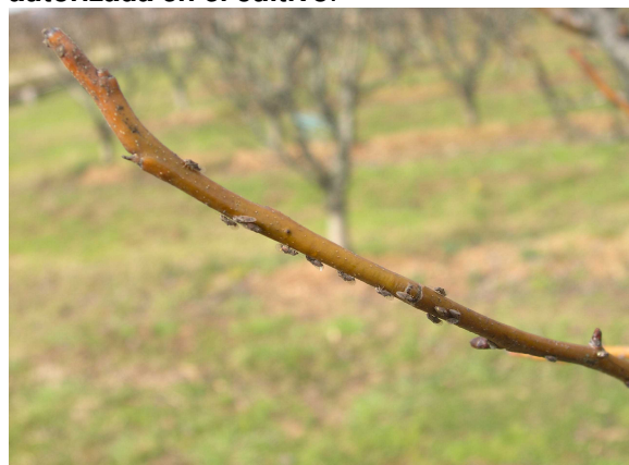
Adultos de Psila sobre rama de peral.

En las parcelas donde no se pudo realizar el tratamiento contra adultos recomendado en el Boletín nº 1 y/o actualmente tienen una alta población invernante, recomendamos tratar ahora contra huevos y adultos utilizando un aceite parafinico + piretrina autorizada en el cultivo .