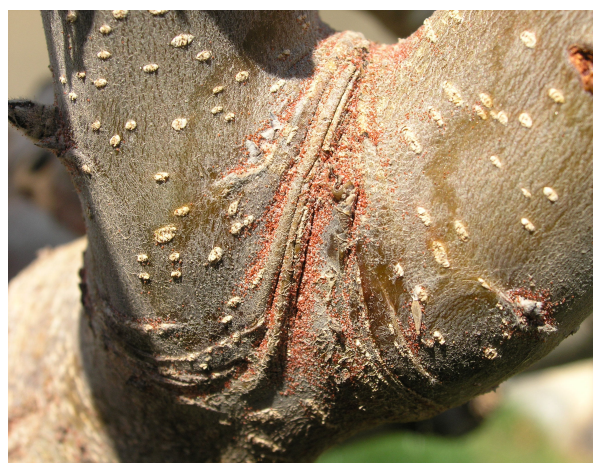
Puesta de araña roja.

En plantaciones con abundante puesta invernante es importante realizar un tratamiento con aceite de parafina* (pr. común) inmediatamente antes de comenzar la eclosión de huevos. En nuestra región y en nuestras variedades este momento suele corresponderse con los estados fenológicos siguientes: manzano (C-C 3 : botón hinchado), melocotonero (E: se ven los estambres) y peral (C-C 3 : botón hinchado). Hay que tener en cuenta que entre el tratamiento con aceite de parafina y los productos azufre, captan, dodina, folpet y polisulfuros deben transcurrir como mínimo 21 días.