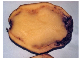
Ejemplo de etiqueta de patata certificada. Síntomas: Clavibacter michiganensis .

Recientemente han aparecido nuevas cepas del VIRUS Y que provocan pequeñas necrosis en los tubérculos. Las variedades con aptitudes para industrialización son las más sensibles. Los tratamientos contra pulgones no permiten en absoluto frenar la transmisión, por lo que se aconseja sembrar patatas certificadas con garantía de que están exentas de virus.