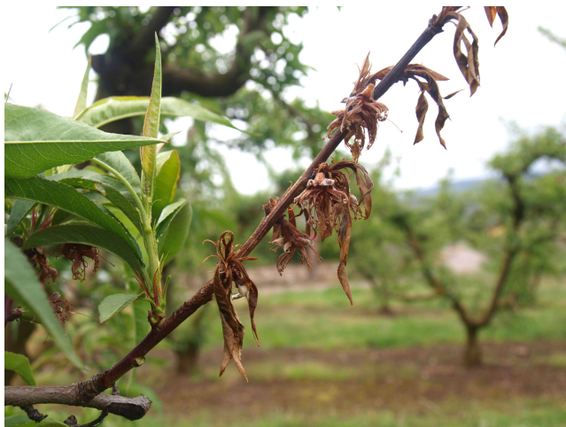
Síntomas de monilia en rama de melocotón.