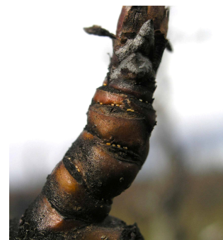
Puesta de psila en peral.

En las parcelas donde no se pudo realizar el tratamiento contra adultos recomendado en el Boletín nº 3 y/o actualmente tienen una alta población invernante, recomendamos tratar ahora contra huevos y adultos utilizando un aceite parafínico + piretrina autorizada en el cultivo .