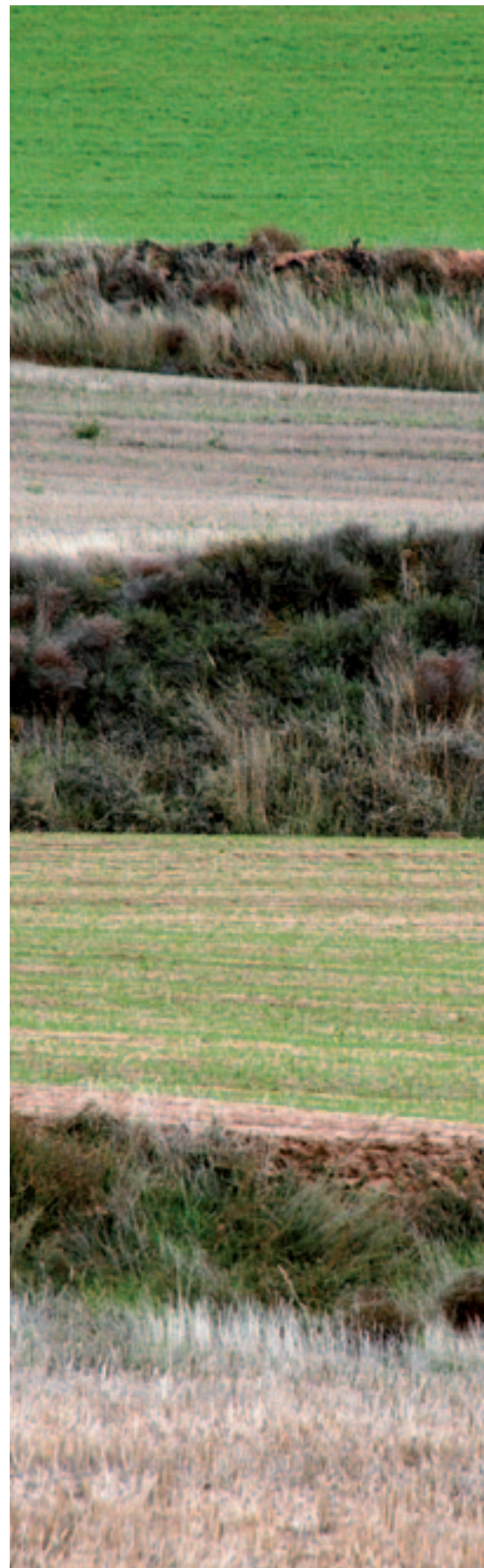
Ribazos, habituales entre las pequeñas parcelas de Rioja Media.

Los agricultores destinarán al menos un 7% de su superficie agrícola, excluidos los pastos permanentes, para propósitos ecológicos: tierras de barbecho, setos, árboles, lindes, elementos paisajísticos, superficies forestadas... Los productores ecológicos y los agricultores cuyas superficies estén total o parcialmente afectadas por las Directivas de hábitat, aves o flora y fauna, o las incluidas en la Red Natura 2000 están