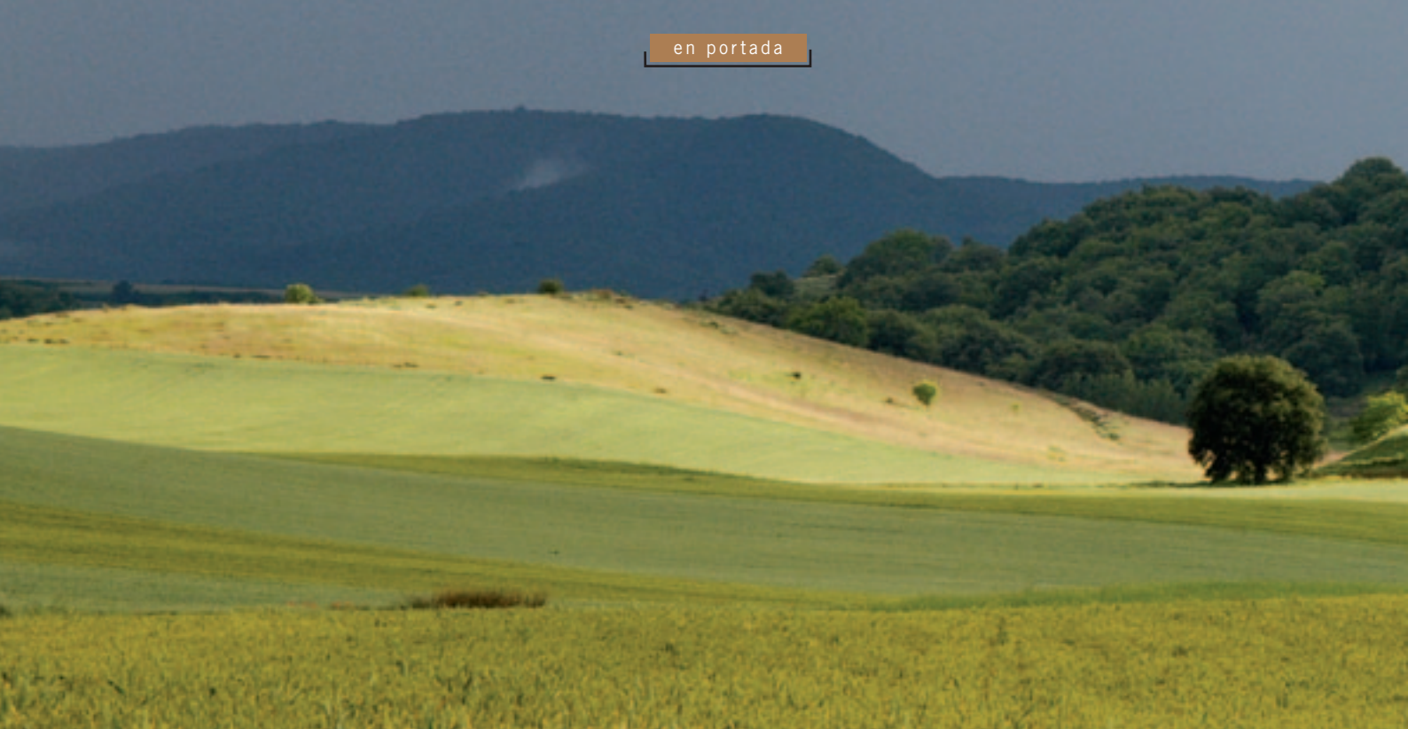
Cereal en el municipio de Azofra.

La propuesta ha recibido el rechazo unánime de las organizaciones agrarias españolas y de los Gobiernos central y autonómicos, incluido el Gobierno de La Rioja, al considerar que no está suficientemente dotada a nivel económico, se incrementan las exigencias medioambientales a los agricultores sin contraprestación, no se articulan medidas eficaces para la regulación de los mercados y se pone en cuestión la viabilidad de determinadas producciones, entre otras cuestiones.