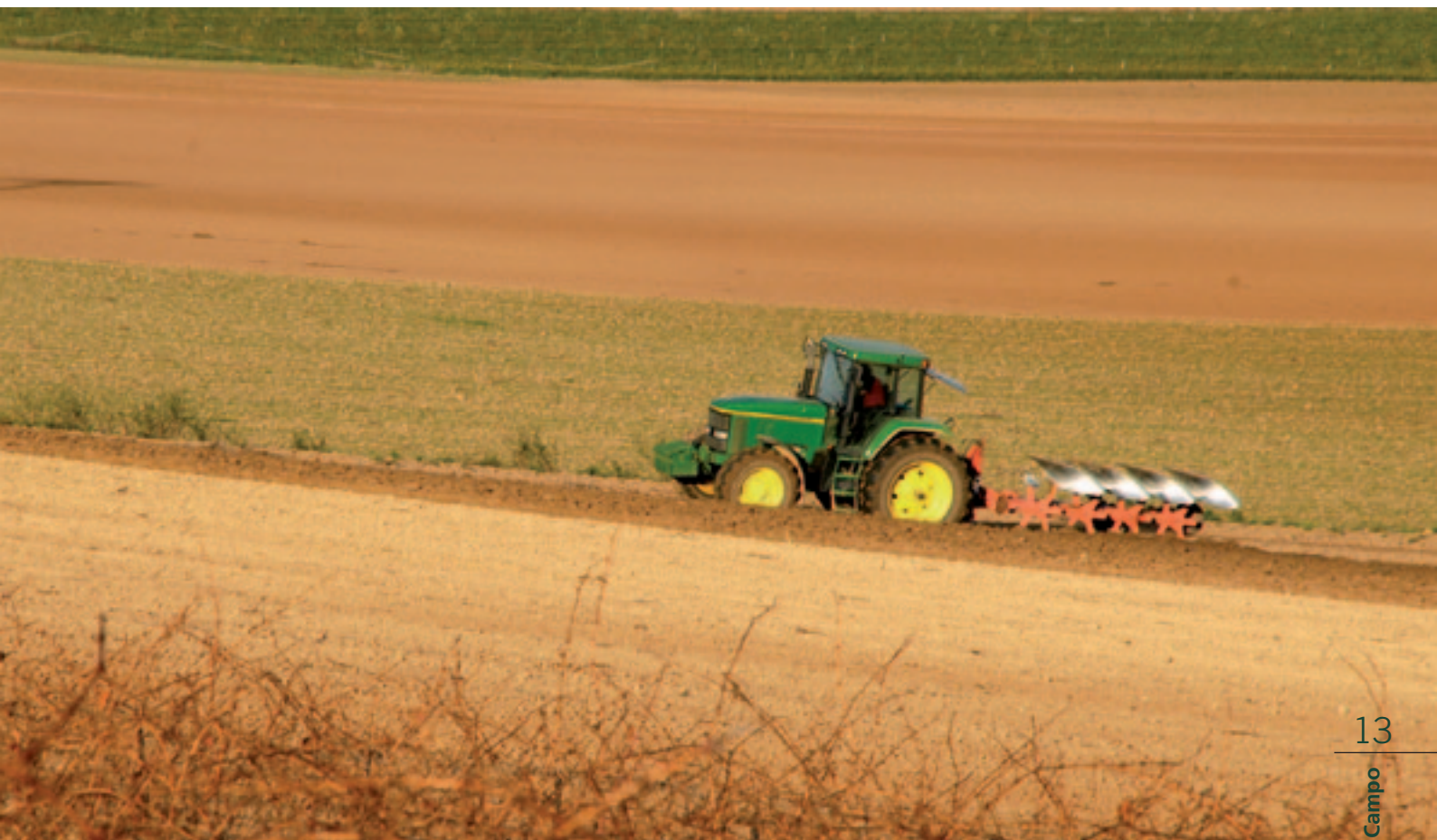
Un agricultor arando la tierra.

un sector estratégico a preservar y potenciar y de cuya actividad dependen cuestiones fundamentales como la calidad y la seguridad alimentaria, la biodiversidad, el equilibrio territorial, etc.